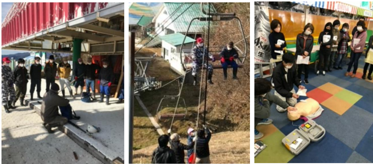
※救助訓練、AED 操作方法講習会実施の様子

索道人身傷害事故ゼロを目標に、安全の維持、向上のため、年度別の保守及び改修計画をたて実施しております。また、安全教育・訓練の実施はもとより、各種講習会等に積極的に、職員の安全に対するレベルアップを図ります。