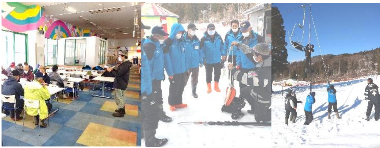
座学、救助訓練の様子

索道人身傷害事故ゼロを目標に、安全の維持、向上のため、年度別の保守及び改修計画をたて実施しております。また、安全教育・訓練の実施はもとより、各種講習会等に積極的に、職員の安全に対するレベルアップを図ります。