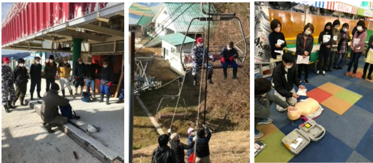
※救助訓練、AED 操作方法講習会実施の様子

索道人身傷害事故ゼロを目標に、安全の維持、向上のため、年度別の保守及び改修計画をたて実施しております。また、安全教育・訓練の実施はもとより、各種講習会等に積極的に、職員の安全に対するレベルアップを図ります。